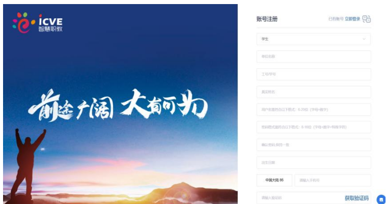
图 2 注册账号

步骤二： 在智慧职教 MOOC 平台（网址： http://mooc.icve.com.cn/ ），搜索《高铁职场礼仪》课程，点击“加入课程”进行课程学习。