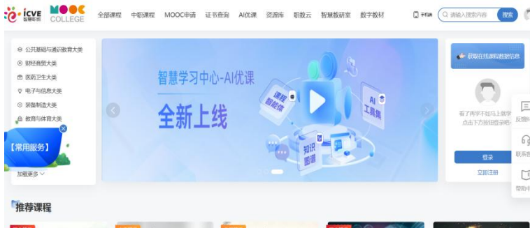
图 1 登录网站